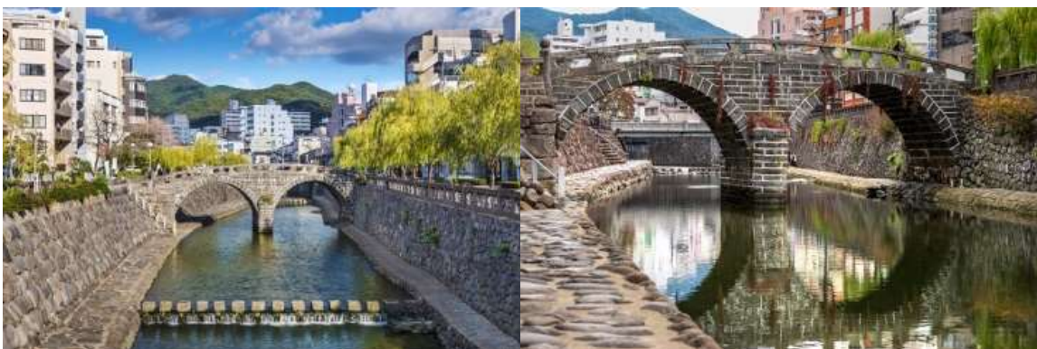
สะพานเมกานะบาชิ (Meganebashi Bridge)

นากาซากิ (Nagasaki) เป็นเมืองที่ตั้งอยู่ทางตะวันตกของเกาะคิวชู ประเทศญี่ปุ่น เมืองนี้เป็นที่รู้จักจากประวัติศาสตร์อันยาวนานและวัฒนธรรมที่หลากหลาย เมืองนี้เป็นที่รู้จักจากชายหาดที่สวยงาม อาหารทะเลสด และสถานที่ท่องเที่ยวทางประวัติศาสตร์และวัฒนธรรมมากมาย