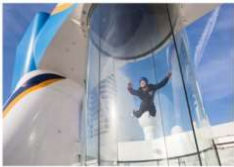
RIPCORD® BY IFLY®